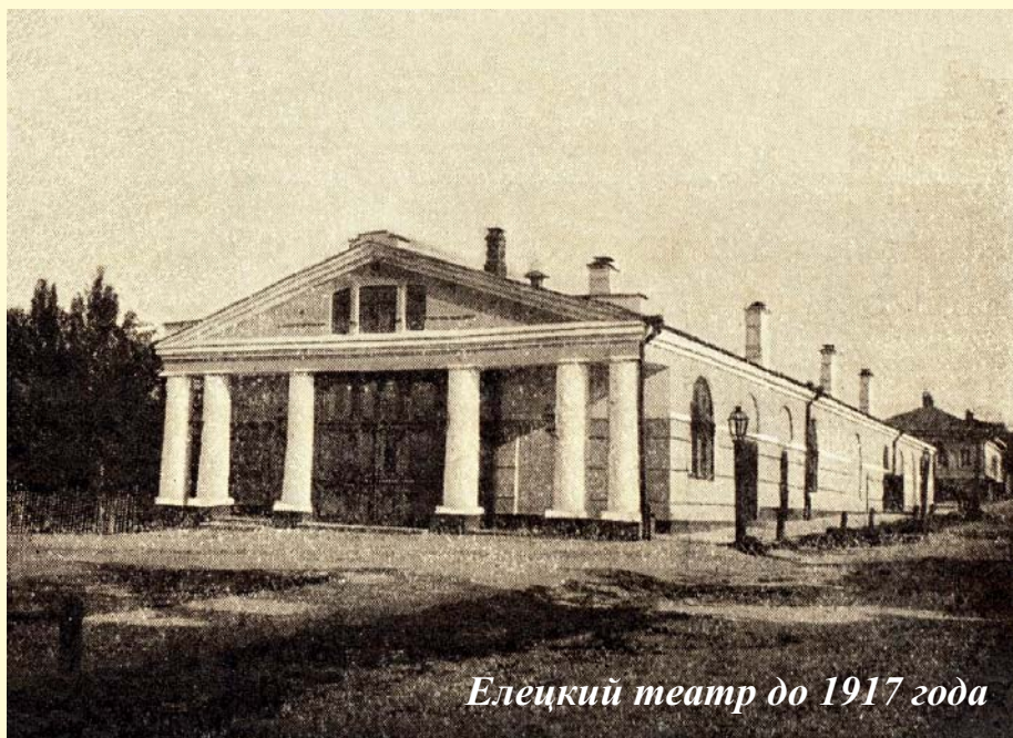
Елецкий театр до 1917 года