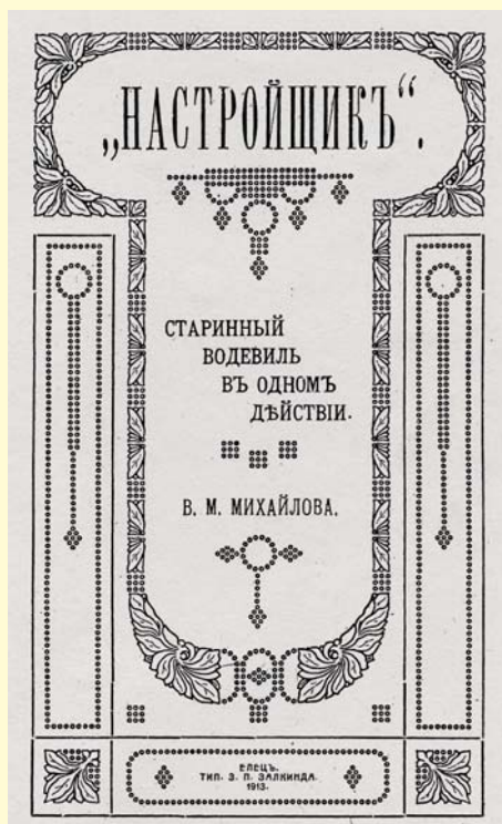
Обложка текста пьесы

подчеркнул, что купцы здесь не дикие, а образованные. Вывод, отнюдь не претендующий на научный, прост: Елец в середине XIX века был известен широкому кругу русской интеллигенции, живо интересующейся искусством, литературой и театром. У него уже был авторитет и, говоря нынешним языком, имидж культурного города, в котором театр занимал первейшее место.