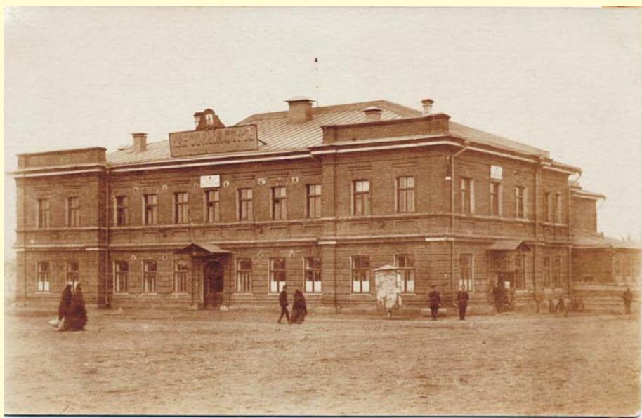
Елецкий Народный дом (с 1911 года), ныне - театр «Бенефис»